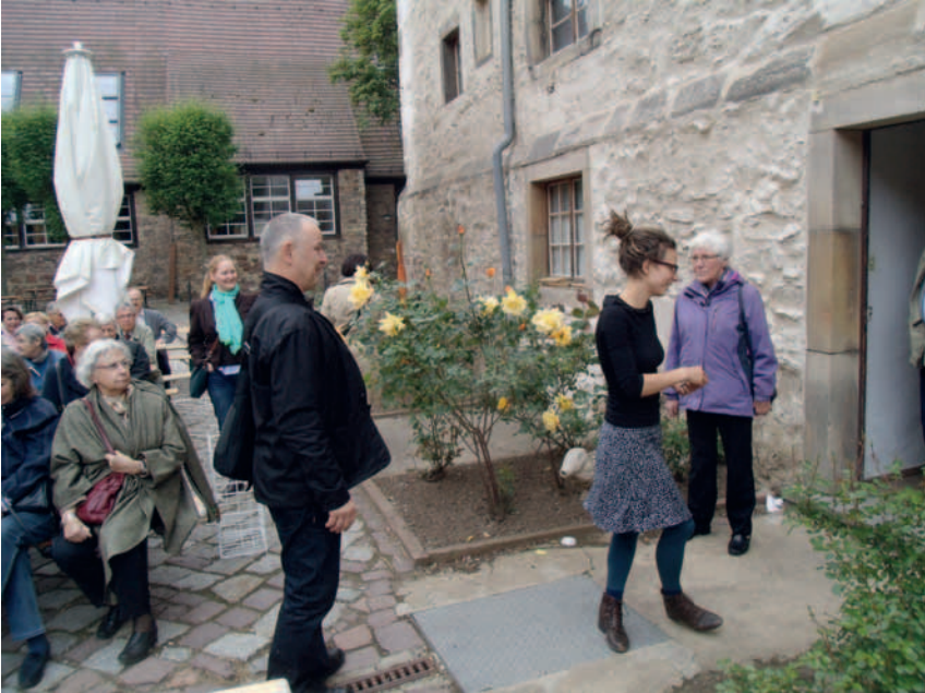
Abbildung 1: Auf dem Weg zu den Ateliers des Studiengangs Buchkunst