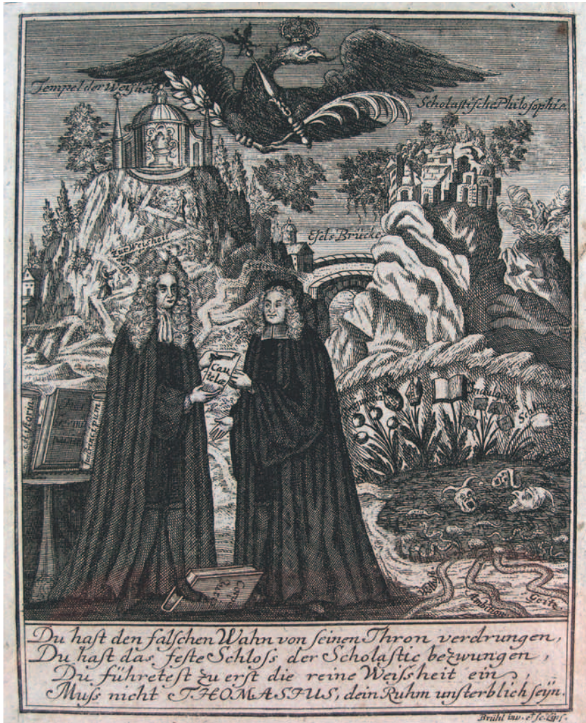
Abbildung 4: Titelkupfer, Christian Thomasius und August Hermann Francke im „Reich derer Todten“; Franckesche Stiftungen zu Halle, FrSt: 173 3b.