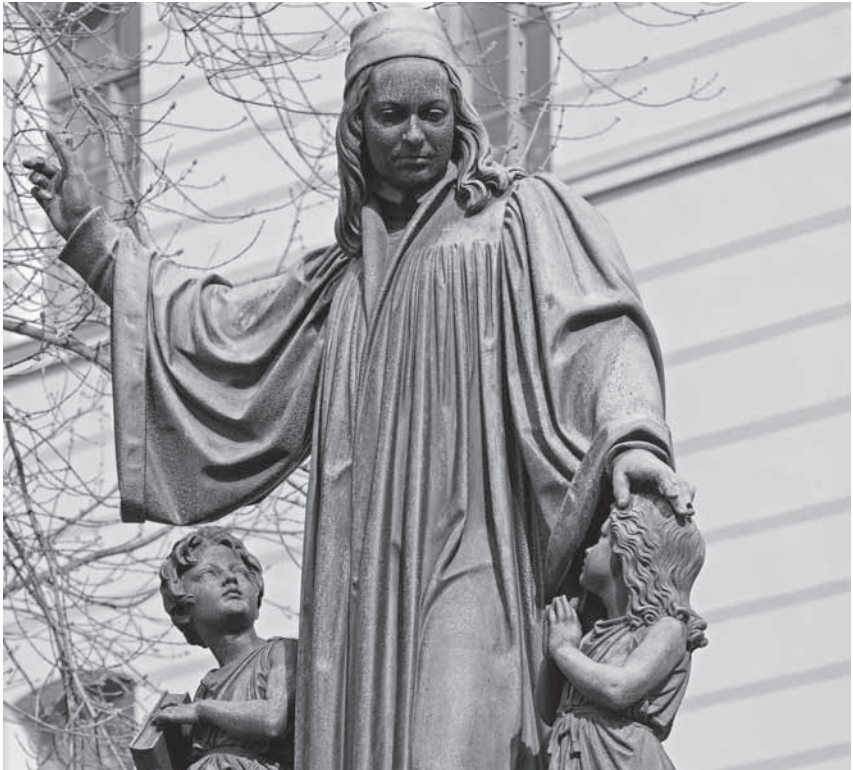
Abbildung 1: Francke-Denkmal

Es gibt keinen zweiten Ort in Deutschland, an dem sich wissenschaftliche Forschung und praxisorientierte Ausbildung, aufbauend auf einem stabilen historischen Fundament, so eng miteinander verbinden wie im Bildungskosmos der Franckeschen Stiftungen. In den seit 1992 aufwändig sanierten Gebäuden der über 300 Jahre alten historischen Schulstadt August Hermann Franckes (1663-1727) sind heute ausnahmslos wissenschaftliche, pädagogische und kulturelle