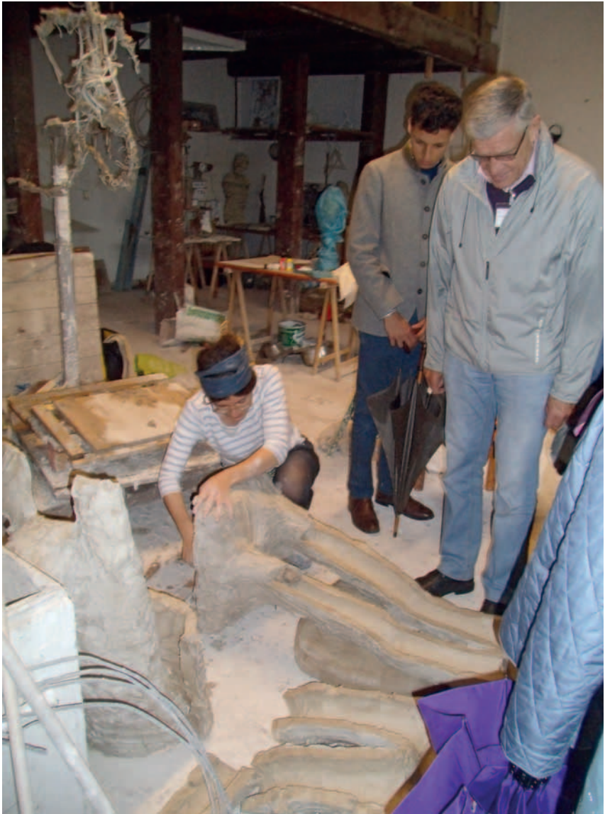
Abbildung 2: Einer jungen Künstlerin über die Schulter geschaut