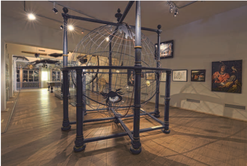
Abbildung 3: Blick in die Kunst- und Naturalienkammer