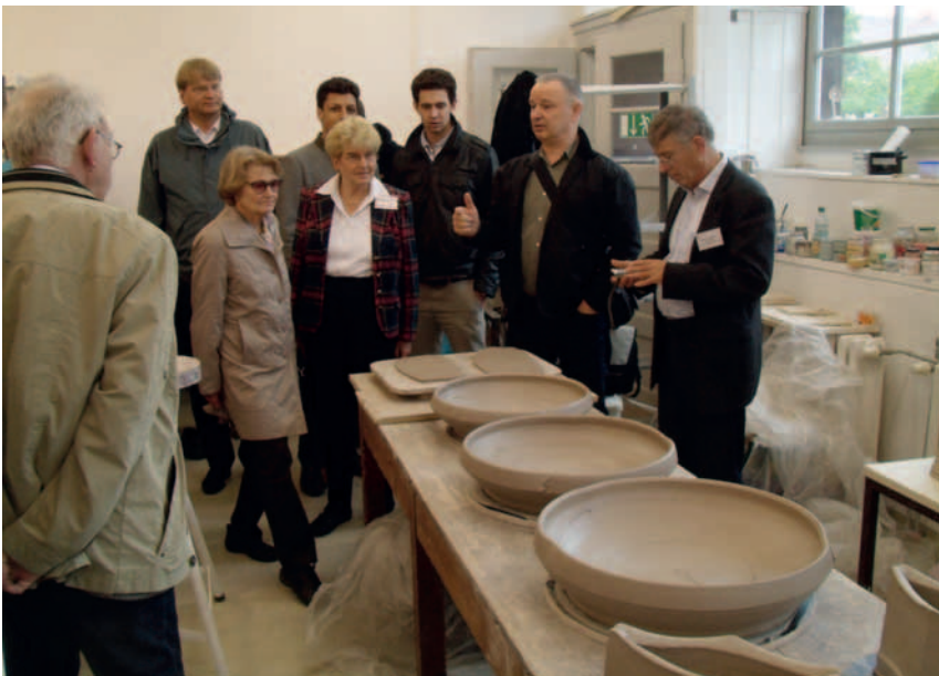
Abbildung 3: Studiengang Plastik, Fachrichtung Keramik, gerade geformte Porzellanrohlinge

Im ebenfalls auf dem Gelände der Unterburg (Campus Kunst) befindlichen Atelier der Fachrichtung Keramik (Studiengang Plastik) von Professor Martin Neubert konnten wir große Schalen aus noch ungebranntem Porzellan bewundern ( Abbildung 3 ). Gastdozent Brad Schwieger (USA) stellte uns seine Gefäßkreationen vor ( Abbildung 4 ).