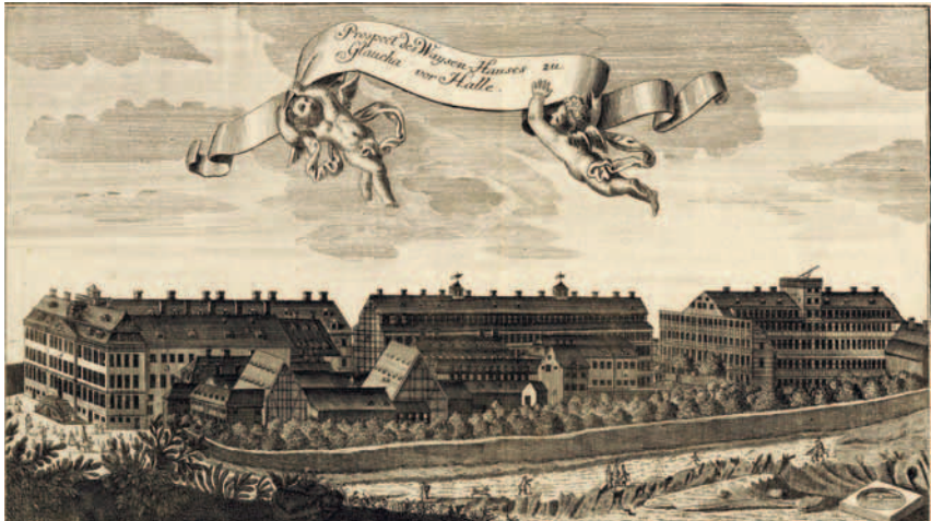
Abbildung 2: Historische Gesamtansicht der Franckeschen Schulstadt

das pansophische Spätwerk „Allgemeine Beratung über die Verbesserung der menschlichen Dinge“. 2 Den „Grundriß eines Bedenkens von der Aufrichtung einer Sozietät in Deutschland“, 1671 von Gottfried Wilhelm Leibniz (1646-1716) entworfen 3 , aber auch die neuen Ideen katholischer Gelehrter im Bildungssektor nahm Francke aufmerksam wahr. 1698 veröffentlichte er die Übersetzung des französischen Bischofs Fénelon „Von der Erziehung der Töchter“ und weist sich damit noch heute als Kenner der Bildungsdiskussion seiner Zeit aus. 4