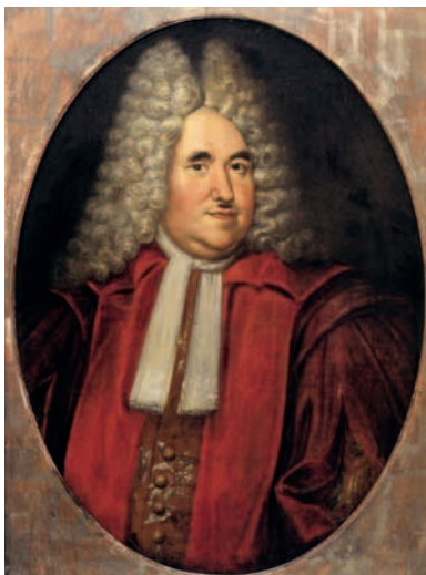
Abbildung 3: Christian Thomasius, Gemälde eines unbekanntem Meisters, frühes 18. Jh.; Martin-Luther-Universität Halle-Wittenberg, Zentrale Kustodie