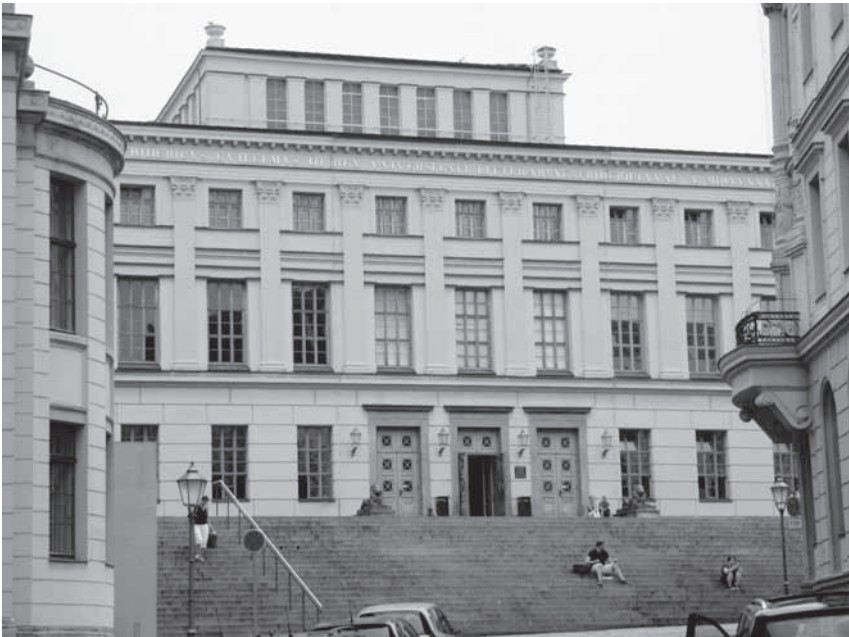
Abbildung 1: Hauptgebäude der Martin-Luther-Universität Halle-Wittenberg; (Foto: H. Lück)

Fürst-Administratoren-Residenz 4 Halle mit einer bescheidenen Ritterakademie 5 zur blühenden kurbrandenburgischen/preußischen Reformuniversität nachzeichnen. Dabei will ich in vier Schritten vorgehen. In einem ersten Schritt sind die wichtigsten äußeren Gründungsvorgänge vorzustellen. Ein zweiter Schritt wird dem Einfluss des Pietismus auf die Gründung gewidmet sein. Drittens ist an Auseinandersetzungen mit dem Pietismus in den Anfangsjahren bzw. Anfangsjahrzehnten der Universität zu erinnern. In einem vierten und letzten Abschnitt möchte ich eine Brücke zur Gegenwart an der Martin-Luther-Universität schlagen.