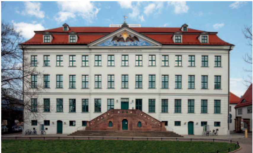
Abbildung 4: Historisches Waisenhaus; Foto: Uwe Gaasch, Bamberg

Heute sind die Franckeschen Stiftungen ein kultureller Bildungskosmos von europäischem Rang mit vielfältigen internationalen Beziehungen. Im Sinne ihres Stifters sind sie eine vom christlichen Geist geprägte Einrichtung, die Menschen, unabhängig von ihrer Herkunft, eine umfassende Bildung und die Fähigkeit zu sozialem Handeln vermitteln möchte. Die rund 40 Einrichtungen in dem historischen Ensemble ( Abbildung 4 zeigt die heutige Ansicht des Waisenhauses, das bereits auf Abbildung 1, links, zu sehen ist) verdichten sich zu einem einzigartigen Zentrum kultureller, pädagogischer, wissenschaftlicher, sozialer und christlicher Aktivitäten. Ihr aus einer mehr als 300-jährigen Geschichte schöpfendes Erbe bewahren die Franckeschen Stiftungen mit Blick auf die heutigen und künftigen Lebensverhältnisse. Die von August Hermann Francke begründeten Traditionslinien bieten die Grundlage für neue Ideen und innovati-